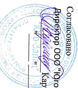
График проведения периодической проверки ДВК и ВК на 2022 г. по жилищному фонду ООО «Юго-Запад»